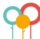
Zorg en aandacht voor de omgeving